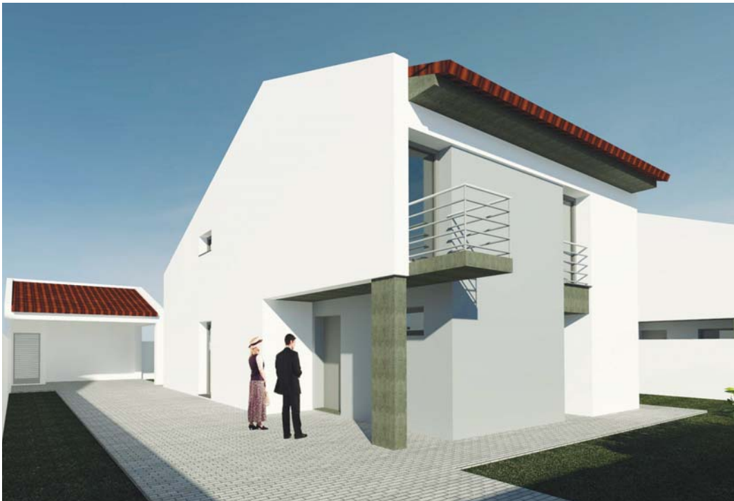
■ Loteamento do Carmo

Houve ao longo do tempo uma evolução nas obras a que a empresa se dedicou e que bem pode dizer-se que existiu sempre espírito de inovação. Recentemente a empresa fez uma incursão no sector imobiliário através do complexo habitacional no Livramento com a denominação de “Loteamento do Carmo” foi uma das obras que marcam uma nova etapa. Como e quando nasceu o referido projecto habitacional?